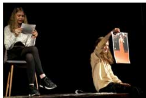
Herečky Malého kokosového stromečku v představení Emoce.

V úterý následoval s hrou Krysa...Ř soubor Spící medvědy v akci. Autorská hra žáků 2.-4. ročníku na motivy slavné legendy Krysař z Hamelnu byla inspirovaná tím, že před rokem jedna z žákyň viděla představení Daniela Landy. Vyprávěla o něm s takovým zápletem, že se po legendu rozhodli i ostatní. „Nejprve se seznámili s několika knižními předlohami a podle nich si začali sami tvořit scénář.