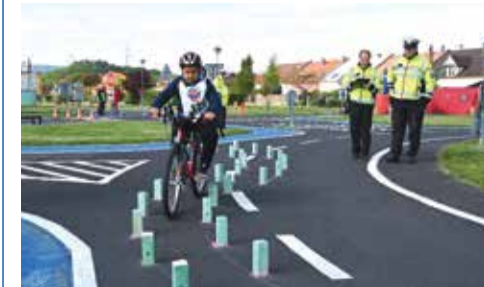
Náš zástupce v soutěži.

Ve dnech 17. a 18. května se v Kadani uskutečnilo krajské kolo dopravní soutěže mladých cyklistů. Soutěž probíhala na dětském dopravním hřišti v Kadani a Autokempu v Prunéřově. V letošním roce hájili barvy Kadaně opět školáci ze Sluníčkové školy, kteří postoupili z okresního do krajského kola v obou kategoriích (I. – 10-12 let, II. – 12-16 let). V teoretické části je čekal test z pravidel silničního provozu a labyrint (řešení cesty po mapě) a v praktické pak jízda po DDH podle předpisů, jízda zručnosti a poskytování první pomoci. Hlavní cenou pro vítězná družstva byl postup do celostátního kola. To se našim zástupcům sice nepodařilo, ale vybojované třetí místo určitě není špatný výsledek.