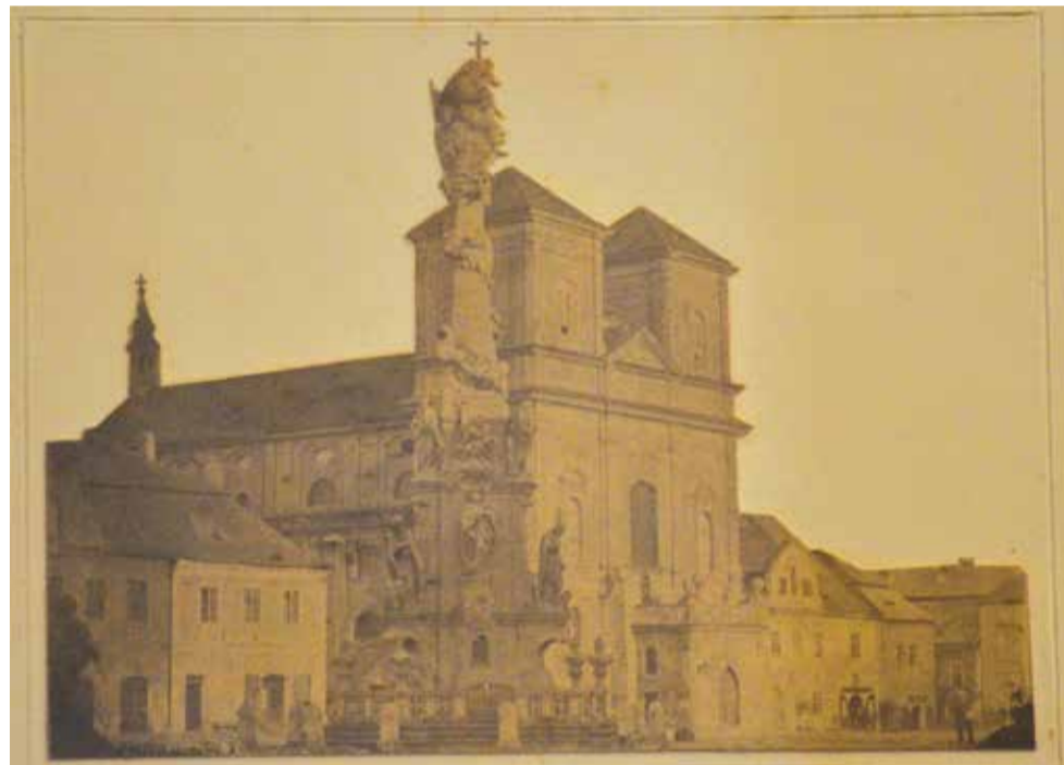
Jedna z nejstarších fotografií Kadaně. Kostel Povýšení sv. Kříže s provizorními věžemi v roce 1861.