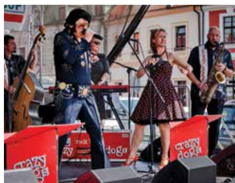
Kapela Crazy Dogs to roztáčela ve velkém stylu. Pomohl jí i král rock 'n rollu a nevkusu Elvis (snímek vlevo). Foto Jiří Hub

V závěru se Chilliman vrhnul na skupinu odvážných soutěžících. Vzduchem létaly tisíce, desetitisíce, statisíce a možná i milióny jednotek SHU. Na talířích se podávaly pochutiny krásné na pohled, ale vražedné po požití a odvážlivci chladili ústa mlékem. Foto Jiří Hub