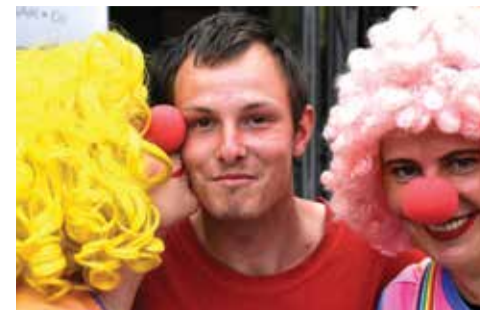
Program si užívali malí, ale i velcí návštěvníci.

Těžké bylo samozřejmě v projekcích pohádek. Hrály se staré osvědčené večerníčky, ale i celovečerní snímky. A nechyběly ani novinky z dílny studentů FAMU.