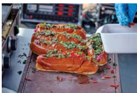
A to je on...hot dog extra speciál...