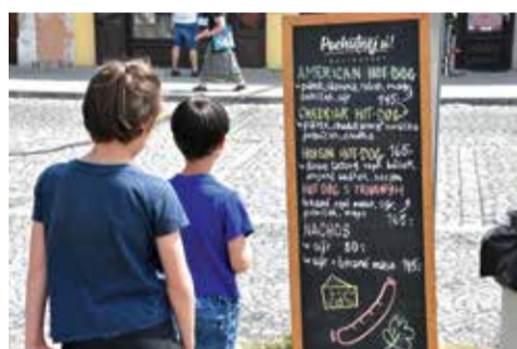
Brácho, tak na tenhle párek v rohlíku asi nemáme...