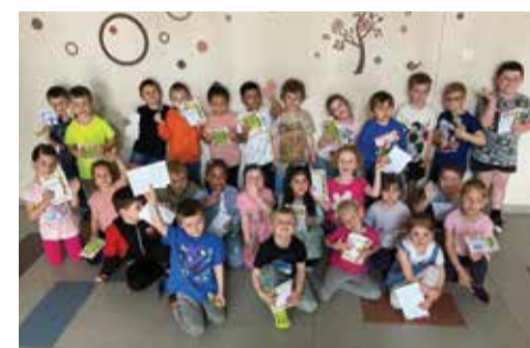
Děti z Dobrého startu.

Již několik let probíhá na naší škole projekt Dobry start, který vždy navazuje na zápis dětí do 1. třídy a který má za cíl usnadnit budoucím prvňáčkům v září vstup do 1. třídy. Od 18. dubna se scházeli s učitelkami každé úterý, seznámili se s prostředím školy, vyzkoušeli si opravdové vyučování a rozvíjeli své vědomosti a znalosti potřebné pro vstup do školy. 23. května se přišli rozloučit i se svými rodiči. Děti si užily hodinku v družině a s rodiči proběhla první třídní schůzka. „Milé děti, děkujeme vašim rodičům za to, že vás k nám každé úterý přivedli, a vám budoucí prvňáčci, děkujeme za vaše nadšení, elán a příjemně strávená dopoledne s vámi.“