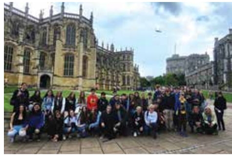
Ve Windsoru.

7. května jsme zahájili náš poznávací zájezd do Velké Británie. Z Kadaně do přístavu Cale a Eurotunelem na britské území. Na první den jsme měli naplánovanou návštěvu čtvrtě Greenwich s observatoří a nultým poledníkem. V námořnickém muzeu jsme si mohli mimo jiné zkusit ovládat loď v přístavu, ať už v doverském, či newyorském. Odtud jsme se vrátili časem, a to k pevnosti Tower, která patří mezi nejvýznamnější památky Londýna. Prohlédli jsme si korunovační klenoty, které byly doslova ještě horké od nedávné korunovace krále Karla III. Po prohlídce pevnosti jsme vstoupili na nejslavnější most Velké Británie – Tower Bridge, a měli jsme štěstí, že se za několik málo minut zvedl, aby pod ním mohla proplout zaoceánská výletní loď. Večer nás přivítaly hostitelské rodiny, které nám poskytly ubytování se stravou.