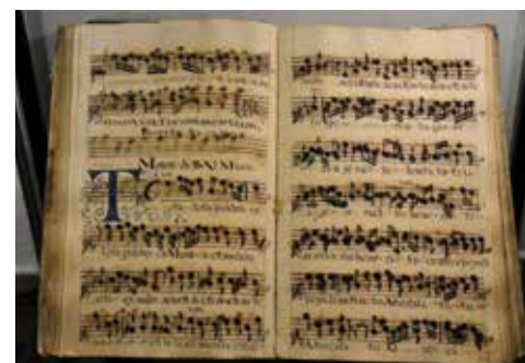
Kancionál z kadaňského alžbětinského kláštera.

Dalším zajímavým exponátem je kancionál (zpěvník) z alžbětinského