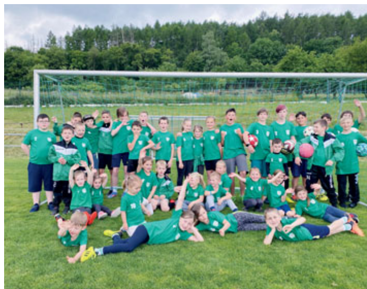
V Rašovicích trénuje spousta dětí včetně dívek