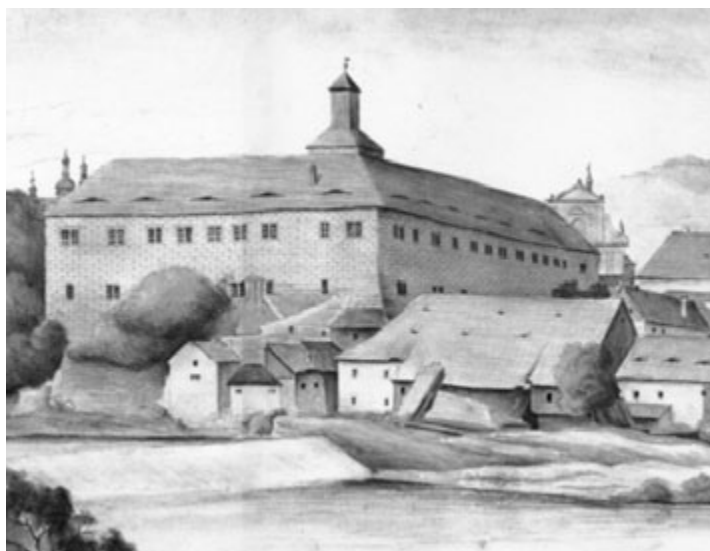
Zámek Klášterec nad Ohří na dobové rytině

Jméno rodu Thun-Hohenstein je s Kláštercem nad Ohří spojováno od roku 1623, přesněji od 2. června tohoto roku. Tehdy koupil Kryštof Šimon Thun panství Klášterec po rodu Fictumů, protože Kryštofovi z Fictumu byl majetek zkonfiskován – aktivně se podílel na stavovském povstání na straně protestantských stavů. Byl také členem tzv. Direktorie, což byl sbor třiceti nekatolických placených direktorů, správců a radů fungující během stavovského povstání, tvořil prozatímní vládu s právem svolávat stavovské sjezdy a zemskou hotovost a vyjednávat s německými kurfiřty a knížaty. Nahradilo sbor místodržitelů a zemské úřady. I přesto, že rod Thunů patřil původně k cizí šlechtě, tak velmi významně, a to po