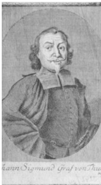
Jan Zikmund Thun

etileté válce sice rod toto hrabství ztratil, ale přídomek ve jméně se používá dodnes. Narodil se 12. září 1582 a byl členem Řádu maltéžských rytířů. V roce 1634 se zúčastnil bitvy u Nördlingenu, ve které byl zraněn a na násled-