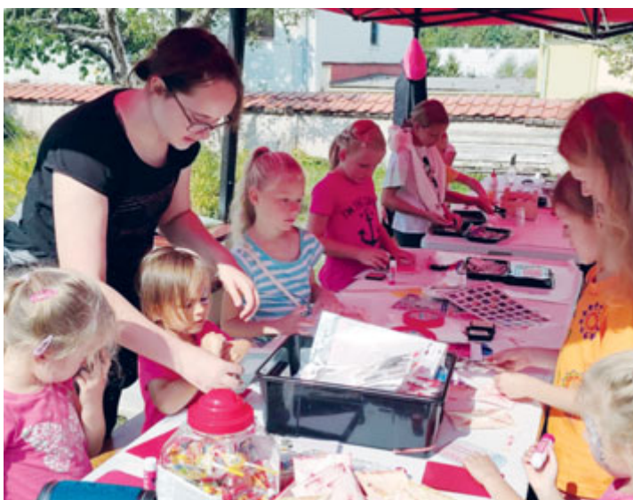
Tvůrčí dílny na farní zahradě v roce 2022