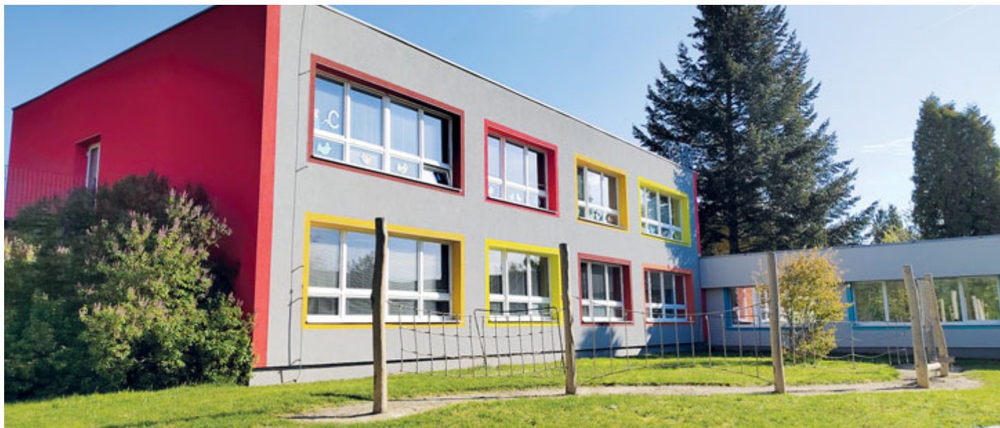
MŠ Bruslička v Souběžné ulici

Obecně ve všech školských zařízeních ve městě během léta probíhá i další nutná údržba, například oprava sociálních zařízení, technického zázemí nebo tříd.