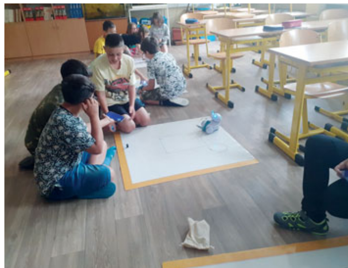
Malování za pomoci robotů