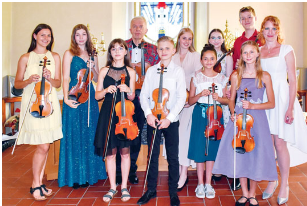
Účastníci houslových kurzů