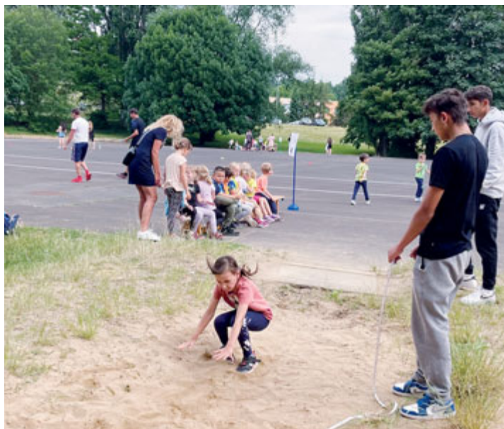
Výkony předškoláků pomáhali měřit žáci třídy 9.A

Před koncem školního roku se na ZŠ Petléřská sešli závodníci ze všech kláštereckých školek a přípravné třídy ZŠ Petléřská, aby zápolili v disciplínách Sazka Olympijského víceboje. Škola připravila pro děti sportovní zápolení v osmi disciplínách: běh na 50 m, člunkový běh 4x 10 m, hod míčkem, hod vzad, jednoskok, skok daleký, dřepy a poskoky snožmo do stran.