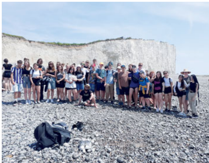
Zájezd do Anglie – procházka po útesech Seven Sisters

V právě uplynulém školním roce jsme na naší škole začali s výukou informatiky po novu . V rámci nových dovedností se žáci učili různými způsoby šifrovat obrázky a text, kreslit 3D obrázky, vytvářet myšlenkové mapy a hledat souvislosti. Rozhodně nejzajímavější částí pro žáky byla výuka programování, kterou jsme zakončili malováním pomocí robotů. Pro žáky pátého ročníku si paní učitelky připravily celoroční sportovní soutěž a nazvaly ji Celoroční olympiáda . V hodinách tělocviku děti plnily různé sportovní disciplíny, které byly průběžně vyhodnocovány, a nako-