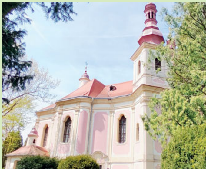
Kostel Panny Marie Utěšitelky na hřbitově