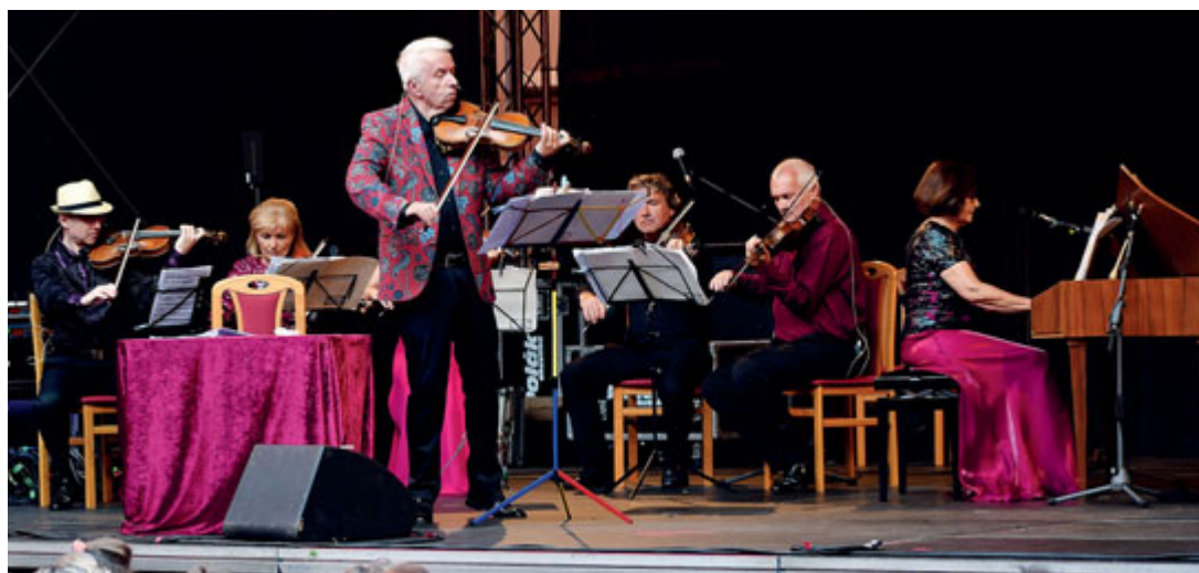
Koncert Johanku, zahraj mi

Jaroslav Svěčený prozradil Kláštereckým novinám, že příprava letošního ročníku trvala bezmála rok. Na jeho programu začal se svými spolupřáteli a spoluorganizátory pracovat v srpnu minulého roku. Pro něj osobně byl oproti předchozím ročníkům výjimečný tím, že na něm zazněl největší počet žánrů a diváci mohli spatřit nejvíce premiérů . „Dnešní doba přináší větší tlak na spolupořadatele festivalu, aby se o něm dozvěděli lidé nejen z Kláštece nad Ohří, ale i z jeho vět-