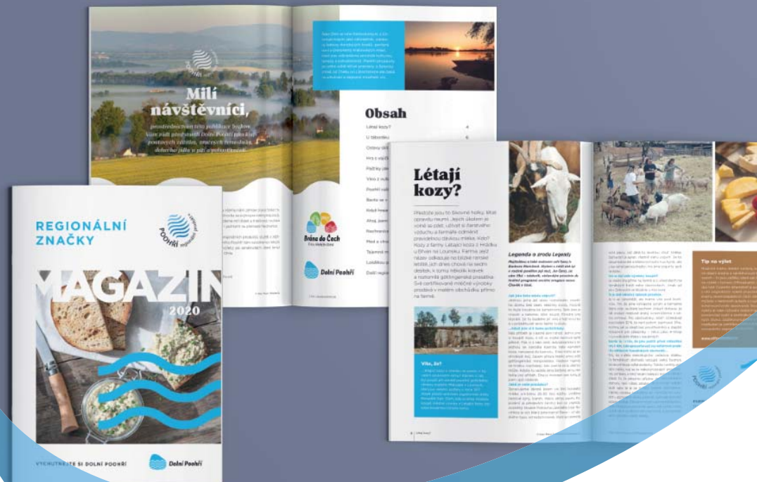
Magazín návštěvníků společnosti Ritztrafik, s.r.o.

V roce 2015 se Poohří připojilo k turistickým oblastem v ČR, které propagují kvalitní a originální produkty a zážitky ze svého regionu. Destinační agentura se stala členem Asociace regionálních značek a převzala administraci značky POOHŘÍ regionální produkt®. Do roku 2021 se uskutečnilo dvanáct certifikačních kol. Komise hodnotí původ, originalitu a jedinečnost výrobků, služeb a zážitků. V průběhu let získalo certifikát přes čtyřicet firem a jednotlivců. V letech 2018 a 2020 vydala agentura výpravnou publikaci Magazín regionálních značek Vychutnejte si Dolní Poohří, kde představila nejzajímavější služby a zážitky.