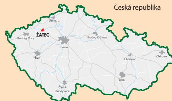
Žatec - centrum