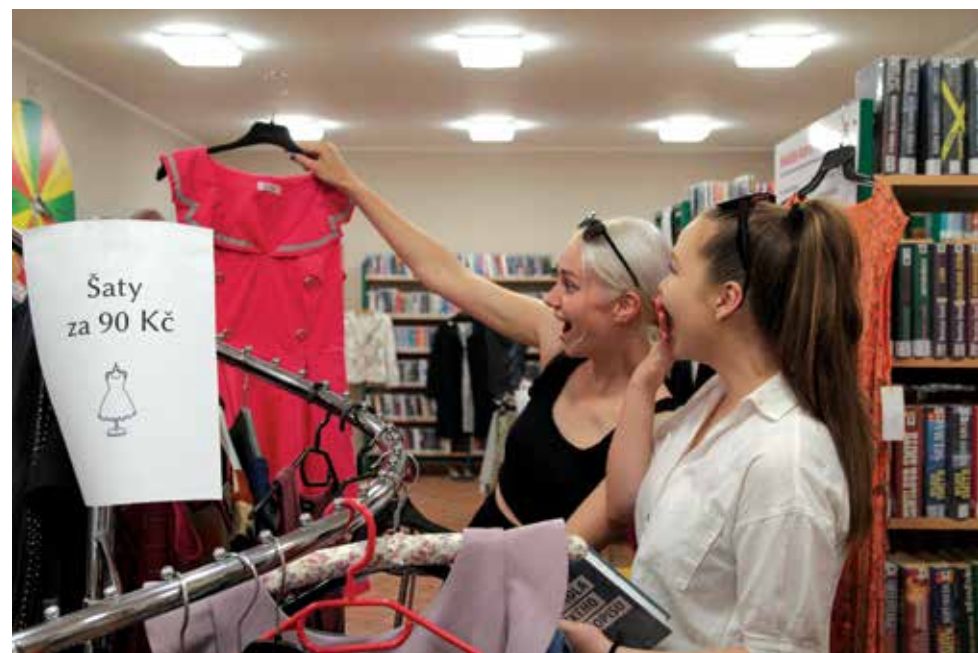
Návštěvnice loňského ročníku Dobročinného bazaru si prohlížejí šaty v prostorách pobočky knihovny.