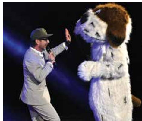
Pídan a Fík. Dobrá dvojka.

Tradiční akce je skvělou zábavou pro všechny zúčastněné. Děti se při ní výborně baví a při pohledu na to, jakou jim udělá radost jen pohled na Fíka na jevišti, má člověk pocit, že svět je aspoň trochu v pořádku. Kulturním zařízením Kadaň a všem, kdo se na ní podílejí, za to patří veliký dík. M. Šil