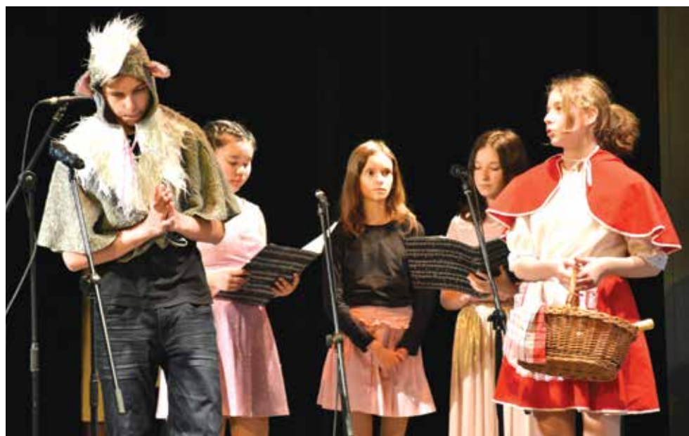
Na přehlídce žáci provedli i fragment z operky Jaroslava Uhlíře a Zdeňka Svěráka Červená Karkulka. Sklidil zaslužený aplaus.

Mezioborová přehlídka kadaňské ZUŠ Klementa Slavického nazvaná Slavík a Klementýnka slavila velký úspěch.