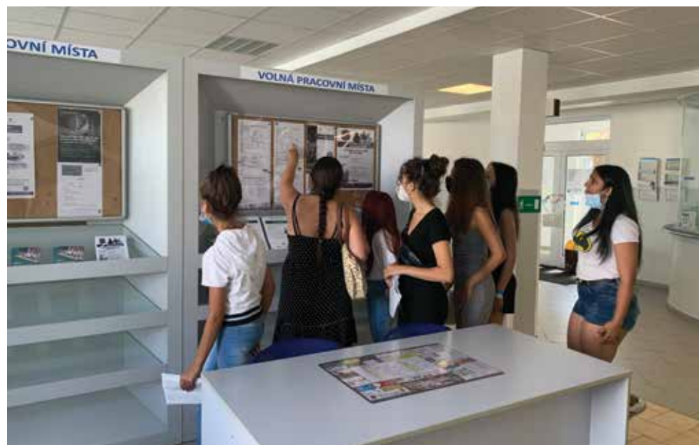
Návštěva účastníků projektu na Úřadu práce.

Světlo Kadaň z.s. od 1. dubna 2023 zahájilo realizaci projektu „Zvýšení uplatnitelnosti mladých osob na trhu práce kariérovým a pracovním poradenstvím v Kadani“, projekt je spolufinancován Evropskou unií. Registrační číslo projektu je CZ.03.02.01/00/22_018/0000852.