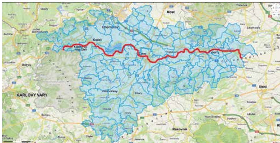
Mapa s trasou Agaratonu.