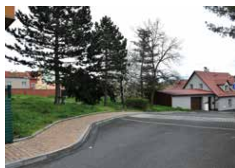
Pohled směrem od Zeleného stromu. Parkoviště vznikne na ploše vlevo.

Ze studie tedy město vypracuje projekt, abychom v dalších letech, možná už v příštím roce, mohli parkoviště vybudovat. M. Šil