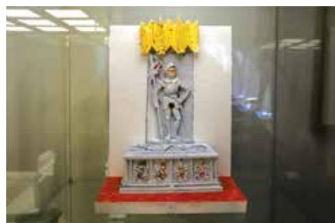
K největším lákadlům výstavy patří bezesporu listiny, které zapůjčil House of Lobkowicz (vlevo), a také replika původní podoby náhrobku Jana Hasištejnského z Lobkowicz od Ulricha Graucze z roku 1516.