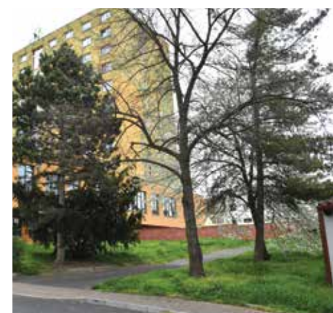
Pohled z Nerudovy ulice k Zelenému stromu.

VELKÝ JARNÍ VÝPRODEJ skladových zásob na firemní prodejně