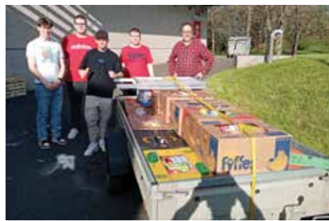
Dobrovolníci při svozu darovaných potravin.

Do sbírky se zapojilo 20 dobrovolníků, kteří darovali 111 hodin ze svého volného času. V charitních barvách se také nově objevilo 10 studentů SPŠ a VOŠ Chomutov, ale i členové ostatních neziskových organizací. „Tak jako z podzimní sbírky, tak i z této darované potraviny rozdělíme samoživitelkám s dětmi, osamělým seniorům, rodinám s nemocnými členy, lidem s postižením, rodinám v přechodných těžkostech, anebo lidem zcela na okraji společnosti,“ vysvětlil ředitel Cha-