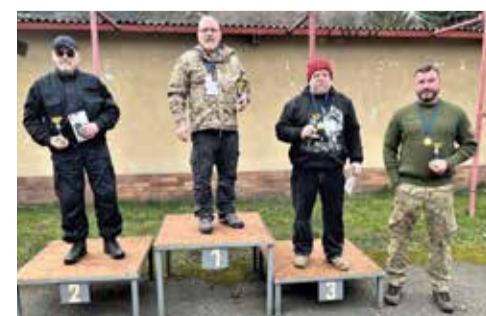
Trojice nejlepších v celkovém hodnocení.