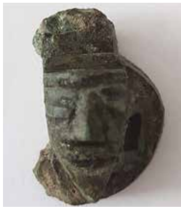
Torzo maskovitého zámku.

Artefaktem, který stojí za zmínku, je torzo maskovitého zámku. Ten se vyráběl v římských podunajských provinciích ve 2.-3. století našeho letopočtu. Je to nálezy vzácný, na našem území počítaný na jednotky kusů. Otázkou ale je, jak a kdy se do Kadaně dostal.