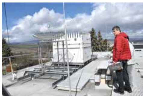
Zařízení na sondáž atmosféry.