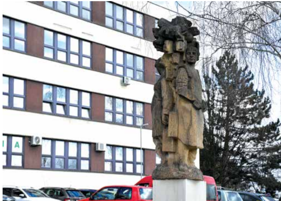
Socha před kadaňskou nemocnicí.