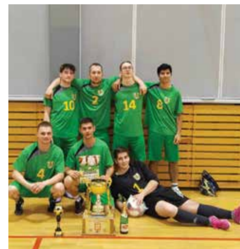
Vítězný tým Jiskra Jirkov.