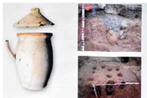
Nádoba nalezená u objektu Kotvy.

Zajímavostí je i keramická nádoba s poklicí nalezená při výzkumu u objektu bývalé Kotvy na Špitálském předměstí. Byla nalezena pod sklípkem zaniklého objektu a jedná se pravděpodobně o obětinu věnovanou domu. M. Šil