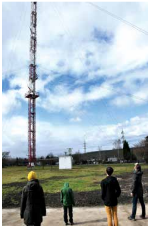
Osmdesátimetrový stožár je dominantou observatoře.

Den otevřených dveří byl velmi vydařenou akcí, která ukázala tuto vědu v její každodenní podobě a lidi, kteří na observatoři pracují, jako její nadšené milovníky. M. Šil