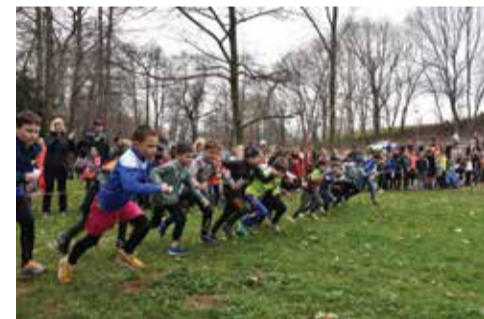
Loňské Kadaňské jarní běhání.