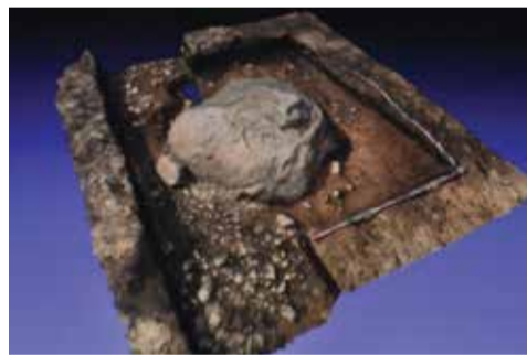
Balvan v původní dlažbě náměstí.