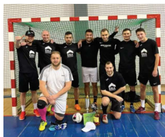
Vítězný tým Auto Macák Chomutov