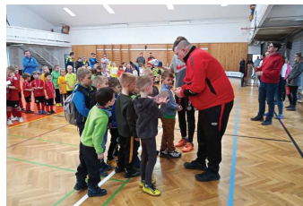
Medaile a sladká odměna pro kadaňský tým.

Dobře ovšem je, že FK Tatran Kadaň vychovává šikovné fotbalisty a může v budoucnu těžit z dobré práce s mládeží. Poděkování za to patří zejména trenérům, kteří se dětem věnují s obrovskou energií. M. Šil