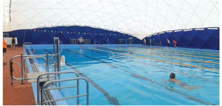
Nafukovací hala nad plaveckým bazénem.

zpochybňovat práci bývalého starosty, udělal pro Kadaň mnoho dobrého v jiných oblastech, za což jsme mu samozřejmě všichni vděční. Je tedy na jeho následovníkovi a zastupitelstvu, jak se v tomto směru zachovají a zda posunou naši krásnou Kadaň na nějakou tu vyšší úroveň.