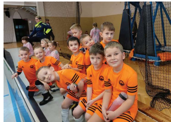
Pohoda mezi zápasů.