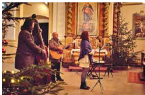
Nerudovské trio StrŠŠ.