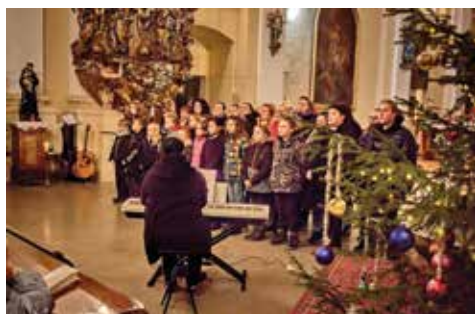
Radoničtí ProRadost.