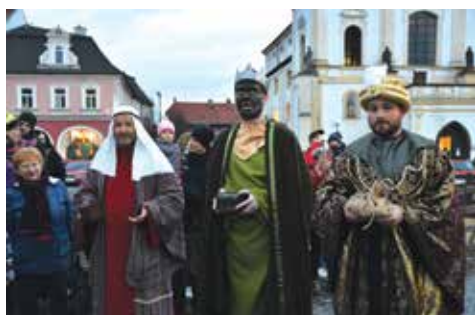
Tři králové přišli za zpěvu.