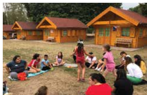
Prázdninový pobyt.

Děkujeme všem donátorům za možnost realizace našich služeb a aktivit. Kamila Roubínová, Světlo, z.s.