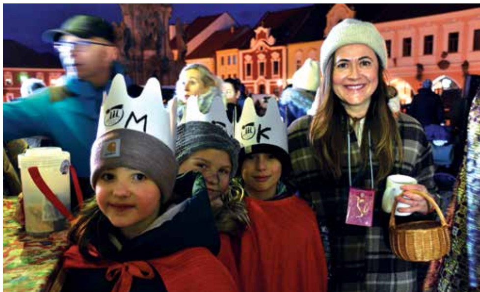
Městem chodili koledníci až do setmění. Foto M. Šíl

Tříkrálová sbírka letos probíhala v mnohem větším rozsahu než v letech minulých. Zahájena byla tradičně - Tříkrálovým setkáním na Mírovém náměstí. Tam nechyběla hudební vystoupení, občerstvení, drobné dárky ani starostovský svačák. Koledníci pak chodili po Kadani a přilehlých obcích celý víkend a někteří i v následujícím týdnu. V neděli 8. ledna pak proběhl v děkanském kostele Povýšení sv. Kříže Tříkrálový koncert. Na něm zahrálo a zazpívalo pět seskupení, která pro zcela zaplněný kostel vytvořila výtečnou atmosféru. M. Šíl, foto Jiří Hub, M. Šíl