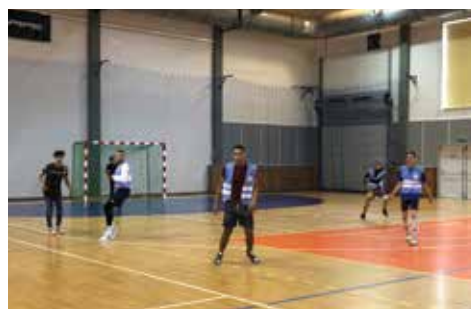
Finále Pouliční ligy.